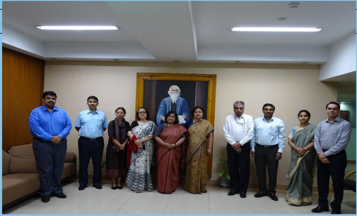
दिनांक 22.02.2023 को हुई बैठक में क्षेत्रीय सलाहकार समिति के सदस्य

क्षेत्रीय सलाहकार समिति की सदस्यों द्वारा दिए गए सुझावों को शामिल करने के बाद 2023-24 के लिए सीओटीपी को अंतिम रूप दिया गया।