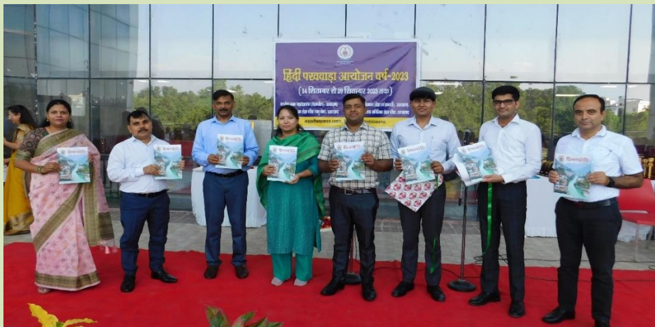
कार्यालय महालेखाकार (लेखा0 एवं हक0) की वार्षिक पत्रिका "हिमज्योति" के त्रयोदश अंक का विमोचन करते हुए प्रधान महालेखाकार (लेखापरीक्षा), महालेखाकार (लेखा0 एवं हक0) एवं अन्य गणमान्य अधिकारी