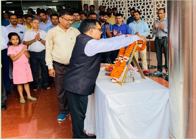
महालेखाकार (लेखा एवं हक०) राष्ट्रपिता महात्मा गाँधी के फोटो पर माल्यार्पण करते हुए।

प्रधान महालेखाकार (लेखापरीक्षा) एवं महालेखाकार (ले० एवं हक०) कार्यालयों द्वारा संयुक्त रूप से 76वें स्वतंत्रता दिवस का आयोजन किया गया। प्रधान महालेखाकार (लेखापरीक्षा) एवं महालेखाकार (लेखा एवं हक०) द्वारा ध्वजारोहण करने के उपरांत उपस्थित अधिकारियों एवं कर्मचारियों को देशभक्ति एवं राष्ट्र एकता का संदेश दिया गया।