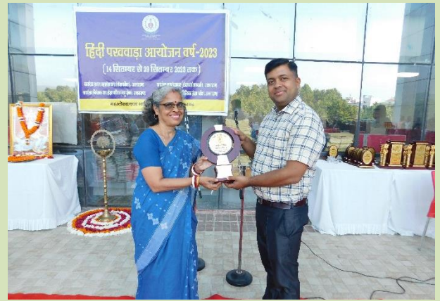
हिंदी पखवाड़े के समापन समारोह के दौरान वरिष्ठ उपमहालेखाकार (प्रशासन) पुरस्कार वितरित करते हुए।