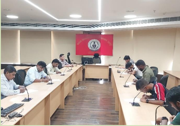
हिंदी पखवाड़े के दौरान सुलेख प्रतियोगिता में प्रतिभाग करने वाले कर्मचारीगण

पखवाड़े के दौरान विभिन्न प्रतियोगिताएं जैसे- निबंध, प्रश्नोत्तरी (क्विज), अनुवाद, हिंदी टंकण आदि का भी आयोजन किया गया। पखवाड़े का समापन दिनांक 29.09.2023 को कार्यालय प्रधान महालेखाकार (लेखापरीक्षा) की वार्षिक हिन्दी पत्रिका "प्रयास" एवं कार्यालय महालेखाकार (लेखा एवं हकदारी) की वार्षिक हिन्दी पत्रिका "हिमज्योति" के विमोचन, पुरस्कार व मिष्ठान वितरण के साथ संपन्न हुआ।