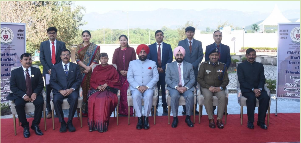
उत्तराखण्ड के राज्यपाल गुरमीत सिंह, प्रमुख सचिव, अपर सचिव, पुलिस महानिदेशक, वन संरक्षक निदेशक एवं महालेखाकार भवन के गणमान्य अधिकारी