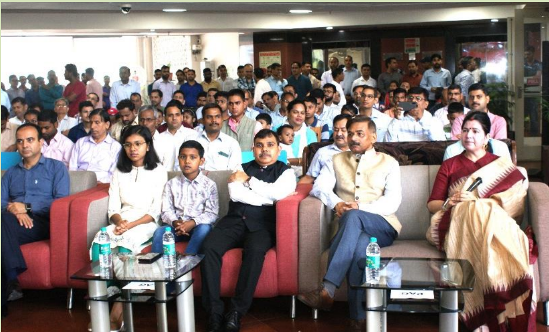
स्वतंत्रता दिवस के उपलक्ष पर कार्यालय के अधिकारी एवं कर्मचारी गण समारोह का आनंद उठाते हुए।