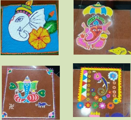
हिंदी पखवाड़े के दौरान कार्यालय की महिला कर्मियों द्वारा बनाई गई रंगोली।