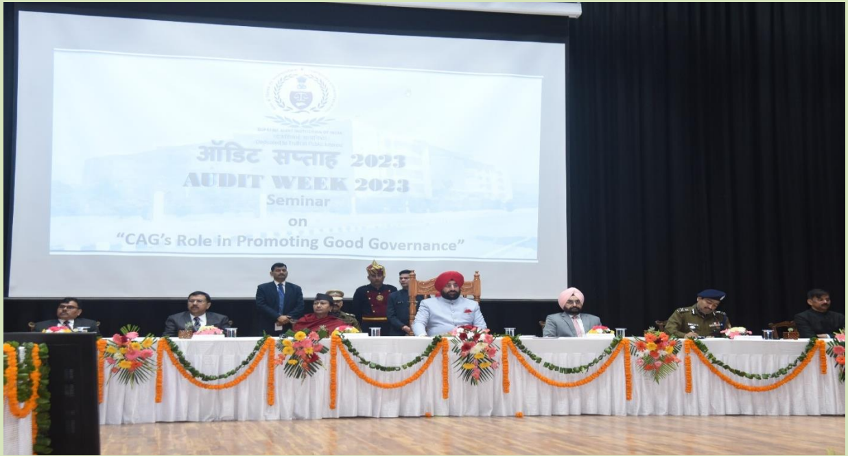
ऑडिट सप्ताह के दौरान आयोजित सेमिनार