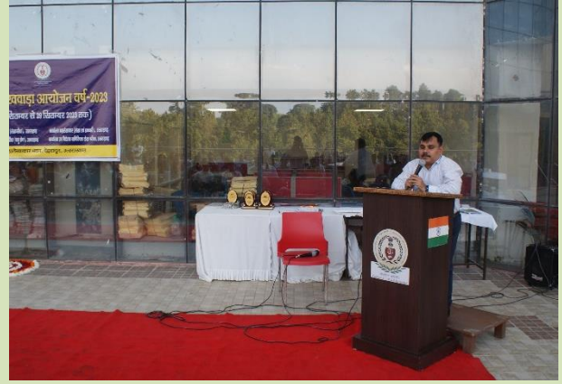
हिंदी पखवाड़े के समापन समारोह के दौरान महालेखाकार (लेखा एवं हक0) सम्बोधन करते हुए।