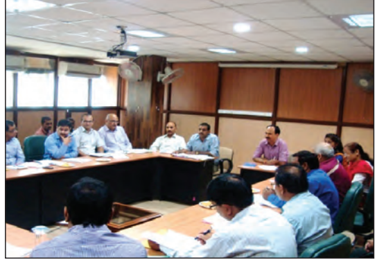
राजभाषा कार्यान्वयन समिति की त्रैमासिक बैठक