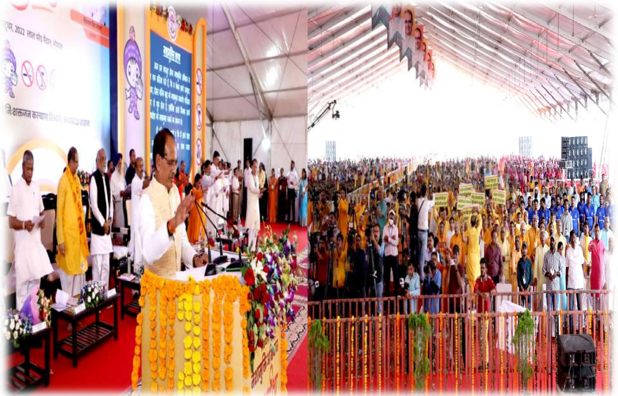
2 अक्टूबर 2022 गांधी जयंती के अवसर पर माननीय मुख्यमंत्री श्री शिवराज सिंह चौहान द्वारा प्रदेश व्यापी नशामुक्ति अभियान का शुभारंभ करते हुए