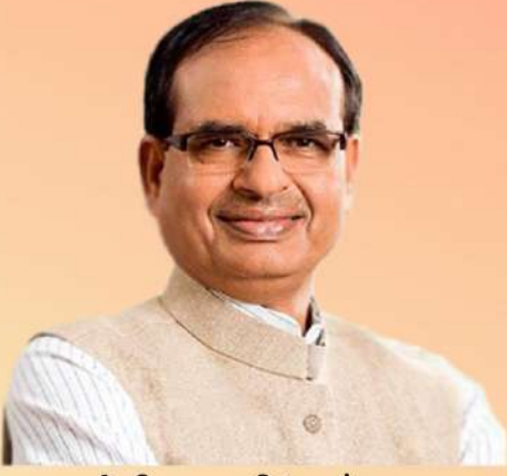
श्री शिवराज सिंह चौहान मुख्यमंत्री, मध्यप्रदेश