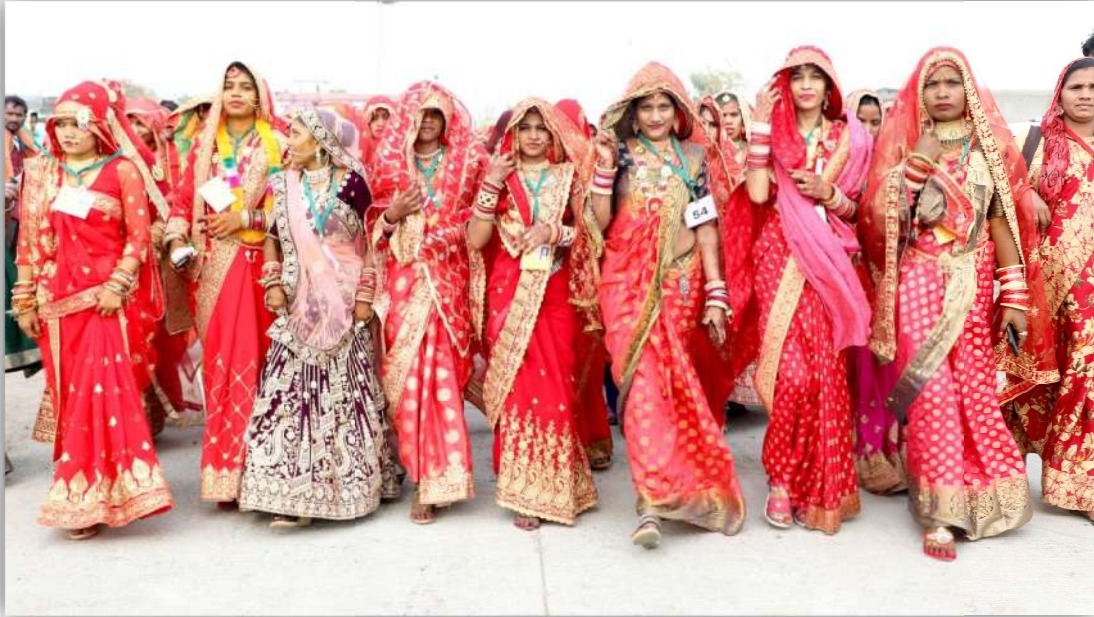
नसरुल्लागंज जिला सीहोर में आयोजित सामूहिक विवाह कार्यक्रम

“योजनांतर्गत सामूहिक विवाह कार्यक्रम में सम्मिलित होकर विवाह सम्पन्न कराने वाली प्रत्येक पात्र कन्या/विधवा(कल्याणी)/परित्यक्ता को राशि रूपये 55000/- प्रति कन्या के मान से स्वीकृत किये जायेंगे, जिसमें से रूपये 11000/- की राशि वधू को अकाउन्ट पेयी चेक एवं रूपये 38000/- की सामग्री वधू को उपहार के रूप में आयोजनकर्ता निकाय द्वारा प्रदाय की जायेगी। रूपये 6000/-सामूहिक विवाह कार्यक्रम आयोजन करने हेतु आयोजनकर्ता निकाय को देय होगी।”