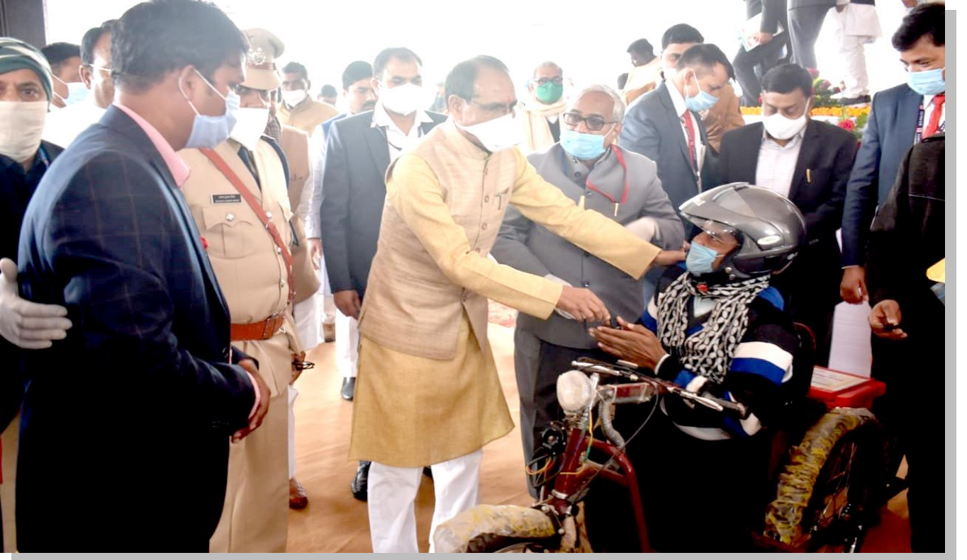
माननीय मुख्यमंत्री श्री शिवराज सिंह चौहान द्वारा जिला रीवा में दिव्यांगजनों को सहायक उपकरण वितरण करते हुए