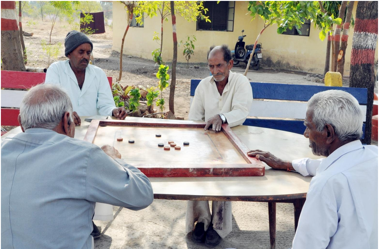
जिला देवास में विभाग द्वारा संचालित वृद्धाश्रम में मनोरंजन करते वरिष्ठजन