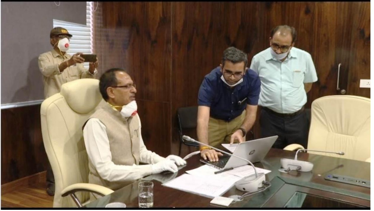
माननीय मुख्यमंत्रीजी श्री शिवराज सिंह चौहान द्वारा दो माह की पेंशन का वितरण हितग्राहियों के बैंक/पोस्ट ऑफिस खातों में सिंगल क्लिक से किया गया