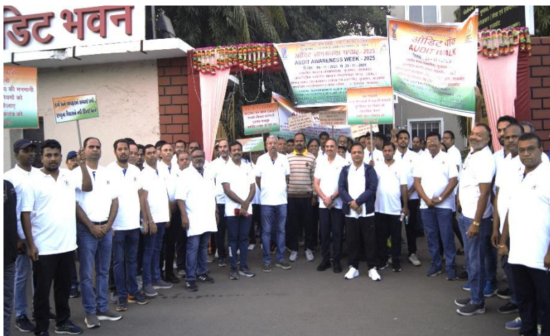
ऑडिट सप्ताह के दौरान ऑडिट वॉक का छायाचित्र