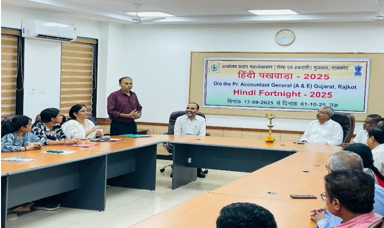
हिंदी पखवाड़ा-2025 का छायाचित्र

अब जब मैं इसके बारे में सोचता हूँ, तो वे उज्ज्वल किरणें हमारी खोई हुई किस्मत की वापसी जैसी लगती हैं। उस रोशनी ने हमारे अगले सात दिनों के लिए एक शानदार आधार तैयार कर दिया था, जो अंडमान में बिताए गए हमारे जीवन के सबसे लुभावने और यादगार दिनों में से एक था।