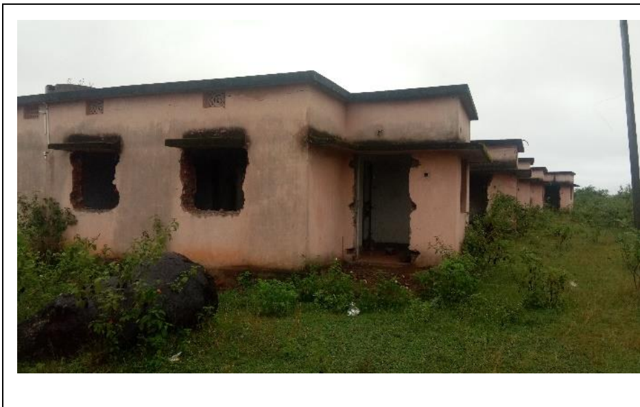
ଚିତ୍ର 5.1: ମୋହନପଡ଼ା ଗ୍ରାମରେ ନିର୍ମିତ ବାସଗୃହ, ଭଗ୍ନ ଅବସ୍ଥାରେ, ଅବ୍ୟବହୃତ ହୋଇ ପଡ଼ି ରହିଥିଲା

ଅତିର ଲକ୍ଷ୍ୟ କଲେ ଯେ, ବାସଗୃହ ନିର୍ମାଣ ପୂର୍ବରୁ, ବିସ୍ତାପିତ ହେବାକୁ ଥିବା ପରିବାରର ସମ୍ପତ୍ତି ଅଣାଯାଇ ନଥିଲା । ଅଧିକତ୍ତ୍ୱ, ଏହି ଘରଗୁଡ଼ିକର ସୁରକ୍ଷା ପାଇଁ ପ୍ରଭାବୀ ପଦକ୍ଷେପ ନିଆଯାଇନଥିଲା ।