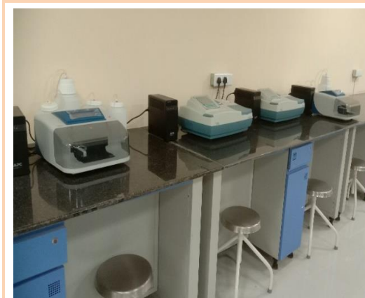
ଏମ୍‌ସିଏଚ୍, ବାରିପଦାରେ ଏଲିସା ରିଡର (20 ଏପ୍ରିଲ 2022)