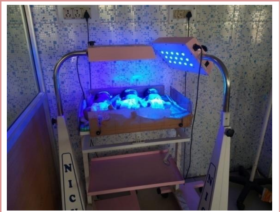
ଡିଏଚ୍‌ଏଚ୍‌ଏଚ୍‌ଏଚ୍‌ଏସ୍‌ଏନ୍‌ସିୟୁ (କ୍ଷେପ୍ ଡାଉନ୍ ୱାର୍ଡ) ରେ ଗୋଟିଏ ଫୋଟୋଥେରାପି ଯୁନିଟ୍‌ରେ ତିନୋଟି ନବଜାତକ ଚିକିତ୍ସିତ ହେଉଛନ୍ତି (ଏପ୍ରିଲ 2022)

ଏହା ଲକ୍ଷ୍ୟ କରାଯାଇଥିଲା ( ଏପ୍ରିଲ 2022) ଯେ 12 ଟି ଉତ୍କଳ ଉଷ୍ମତା (ମୂଲ୍ୟ: 3.20 ଲକ୍ଷ ଟଙ୍କା) ଏବଂ ତିନିଟି ଫୋଟୋଥେରାପି ଯୁନିଟ୍ (ମୂଲ୍ୟ: 1.02 ଲକ୍ଷ ଟଙ୍କା), ଭଦ୍ରକର ଡିଏଚ୍‌ଏଚ୍‌ଏଚ୍ ଏସ୍‌ଏନ୍‌ସିୟୁ ରେ ଏକ ବର୍ଷ ଧରି ନିଷ୍ପିନ୍ଧ ହୋଇ ରହିଥିଲା । ମାନବସମ୍ବଳର ଅଭାବ (ଡାକ୍ତର ଏବଂ ନର୍ସ) ଫଳାଫଳ ଅନୁଯାୟୀ, ଉପକରଣର ଉପଲବ୍ଧତା ସତ୍ତ୍ୱେ ସେବା ଗୁଣବତ୍ତା ବିପର୍ଯ୍ୟୟ ହୋଇପଡ଼ିଥିଲା, କାରଣ ଗୋଟିଏ ଫୋଟୋଥେରାପି ଯୁନିଟ୍‌ରେ ତିନୋଟି ନବଜାତକ ଚିକିତ୍ସିତ ହେଉଥିବା ଦେଖିବାକୁ ମିଳିଥିଲା ପ୍ରକୃତ ଆବଶ୍ୟକତାଠାରୁ ଅଧିକ ଯତ୍ନପାତି ଗ୍ରହଣ ହେଉ ନିଷ୍ପିନ୍ଧ ।