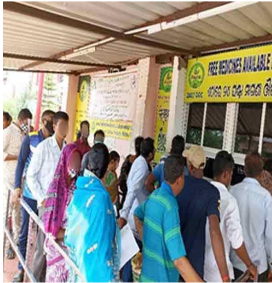
ଡ୍ରଗ୍ସ ସଂଗ୍ରହ ପାଇଁ ଡିଏଚ୍ଏଚ୍, ଭଦ୍ରକର ଡିଡିସିରେ ଅପେକ୍ଷା କରିଥିବା ଓପିଡି ରୋଗୀ (4 ଜୁନ୍ 2022)