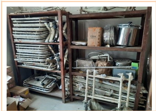
ଡିଏଚ୍ଏଚ୍, ବେଙ୍କାନାଳାଠାରେ ଅକର୍ମଣ୍ୟ ଉପକରଣ ଗଚ୍ଛିତ ହୋଇଛି (29 ଏପ୍ରିଲ 2022)

ସମାକ୍ଷା ଲକ୍ଷ୍ୟ କରିଥିଲେ ଯେ ଜାନୁଆରୀ 2020 ରୁ ସେପ୍ଟେମ୍ବର 2021 ମଧ୍ୟରେ ମେସର୍ସ କିଲୋଙ୍କର ଟେକ୍ନୋଲୋଜିକସ୍ ପ୍ରାଇଭେଟ ଲିମିଟେଡ୍ (କେଟିପିଏଲ) ଦ୍ଵାରା 5,771 ପ୍ରକାର ଉପକରଣ ଯାହାର ମୂଲ୍ୟ 33.23 କୋଟି ଟଙ୍କାର ନିଷ୍ପାସନ ପାଇଁ ପ୍ରସ୍ତାବ ଦିଆଯାଇଥିଲା । ଏହି ଉପକରଣ ସାମଗ୍ରୀ ରାଜ୍ୟରେ ବିଭିନ୍ନ ସ୍ଵାସ୍ଥ୍ୟ ପ୍ରତିଷ୍ଠାନରେ ପଡ଼ି ରହିଥିଲା । ତେବେ ମାର୍ଚ୍ଚ 2022 ସୁଦ୍ଧା ନିଷ୍ପାସନ ପ୍ରସ୍ତାବ ଉପରେ କୌଣସି ପଦକ୍ଷେପ ନିଆଯାଇନଥିଲା । ନିଷ୍ପାସିତ/ ଅକର୍ମଣ୍ୟ ଇଆଇଏଫ୍ ର ନିଷ୍ପାସନ ନହେବା, ଏହା କେବଳ ଅନାବଶ୍ୟକ ଜାଗା ଦଖଲ କରିନଥିଲା ବରଂ ତାତ୍ତ୍ଵଗୋନାଗୁଡ଼ିକରେ ଏକ ଅସ୍ଵାସ୍ଥ୍ୟକର ପରିବେଶ ସୃଷ୍ଟି କରିଥିଲା ।