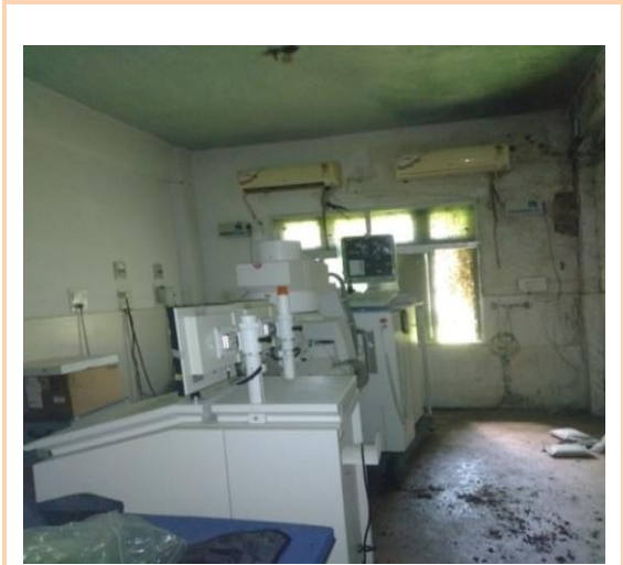
ଏମ୍‌କେସିଜି, ଏମ୍‌ସିଏଚ୍‌ର ଯୁରୋଲୋଜି ବିଭାଗରେ ଲିଥୋଟ୍ରିସ୍ଟି ମେସିନ୍ ଅବ୍ୟବହୃତ ହୋଇ ରହିଛି (29 ଜୁଲାଇ 2022)

ଅଗଷ୍ଟ 2012 ରେ ଏମ୍‌କେସିଜି ଏମ୍‌ସିଏଚ୍‌ର ଇନଡୋର ହସ୍ପିଟାଲ୍ ବିଲ୍ଡିଂକୁ ଅସୁରକ୍ଷିତ ଘୋଷିତ କରାଯାଇଥିଲା । ସ୍ୱାସ୍ଥ୍ୟ ଏବଂ ପରିବାର କଲ୍ୟାଣ ବିଭାଗ (ଅକ୍ଟୋବର 2012) ଉକ୍ତ ବିଲ୍ଡିଂରେ କାର୍ଯ୍ୟ କରୁଥିବା କାର୍ଡିଓଲୋଜି ବିଭାଗକୁ ଅନ୍ୟ ସ୍ଥାନକୁ ସ୍ଥାନାନ୍ତର କରିବାକୁ କଲେଜର ପ୍ରିନ୍ସିପାଲ ଏବଂ ତିନିଜଣ ନିର୍ଦ୍ଦେଶ ଦେଇଥିଲେ । କଲେଜ କର୍ତ୍ତୃପକ୍ଷ ପ୍ରାରମ୍ଭିକ କାର୍ଯ୍ୟାନୁଷ୍ଠାନ ଗ୍ରହଣ କଲେ ନାହିଁ ଏବଂ ମାର୍ଚ୍ଚ 2022 ପର୍ଯ୍ୟନ୍ତ ଅସୁରକ୍ଷିତ ବିଲ୍ଡିଂରେ କାର୍ଡିଓଲୋଜି ବିଭାଗ କାର୍ଯ୍ୟ ଜାରି ରଖୁଥିଲା । ସୁପରିଣ୍ଡେଣ୍ଡେଣ୍ଟ, ଏମ୍‌କେସିଜି, ଏମ୍‌ସିଏଚ୍, ବିଲ୍ଡିଂ ନଅ ବର୍ଷ ଅସୁରକ୍ଷିତ ଘୋଷିତ ହେବା ପରେ ଡିସେମ୍ବର 2021 ରେ, ସିମେନ୍ଟ୍ ହେଲ୍ଡ କେମ୍ବର ପ୍ରାଇଭେଟ୍ ଲିମିଟେଡ୍, ରାଉରକେଲା, କାର୍ଡିଓଲୋଜି ବିଭାଗର କ୍ୟାଥ ଲ୍ୟାବକୁ ଭାଙ୍ଗିବା ଏବଂ ପୁନଃ ସ୍ଥାପନ କରିବା ପାଇଁ ଦାୟିତ୍ୱ ନ୍ୟସ୍ତ କରିଥିଲେ । ମିଳିତ ସରକାରିନ ଡଡ଼ (8 ଜୁଲାଇ 2022) ସମୟରେ, କ୍ୟାଥ ଲ୍ୟାବ୍ ଏବଂ ଆନୁସଙ୍ଗିକ ଯାହାର ମୂଲ୍ୟ 3.13 କୋଟି ଟଙ୍କା ସ୍ଥାନାନ୍ତର ହୋଇନଥିବା ଏବଂ ନିଷ୍ପତ୍ତ ହୋଇ ପଡ଼ିଥିବାର ଦେଖିବାକୁ ମିଳିଥିଲା ।