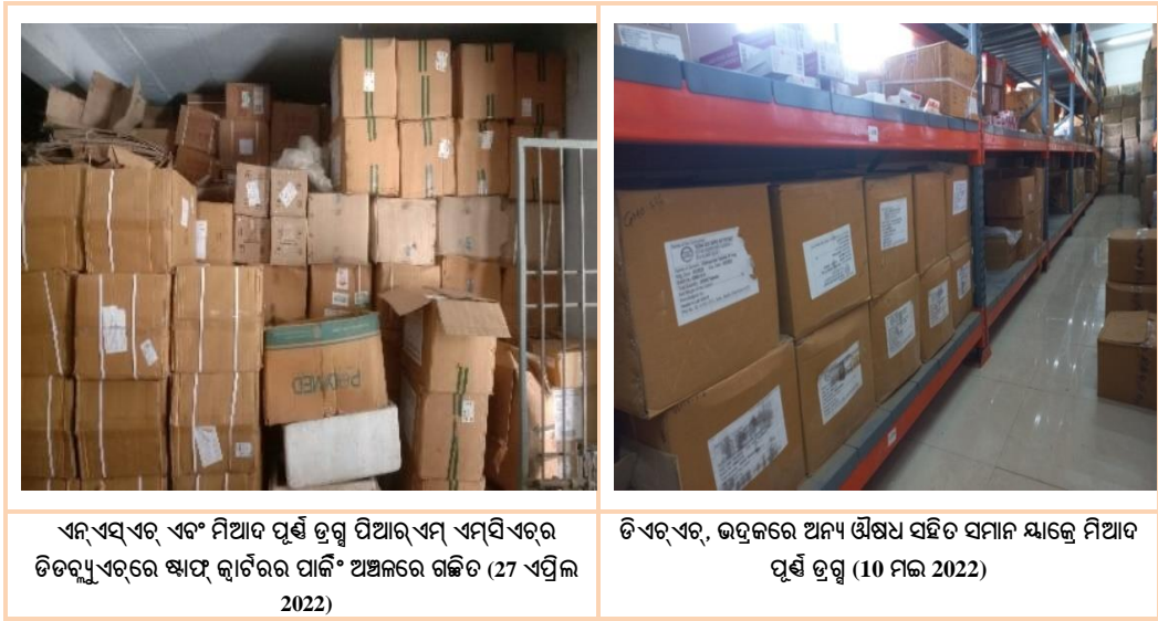
ଏନ୍‌ଏସ୍‌କ୍ୟୁ ଏବଂ ମିଆଦ ପୂର୍ଣ୍ଣ ଡ୍ରଗ୍ସ ପିଆର୍ଏମ୍ ଏମ୍‌ସିଏଚ୍ରେ ଡିଡ୍ରାମ୍‌ସ୍‌ଏଚ୍ରେ ଷ୍ଟାଫ୍ କ୍ୱାର୍ଟରର ପାର୍ଟି ଅଞ୍ଚଳରେ ଗଢ଼ିତ (27 ଏପ୍ରିଲ 2022)

ଅତିର୍ତ୍ତ ଦେଖିଲା ଯେ, କ୍ଷତିଗ୍ରସ୍ତ, ମିଆଦ ପୂର୍ଣ୍ଣ ଏବଂ ଏନ୍‌ଏସ୍‌କ୍ୟୁ ଡ୍ରଗ୍ସ ଗୁଡ଼ିକ ପରୀକ୍ଷା ଯାଞ୍ଚ ଜିଲ୍ଲାଗୁଡ଼ିକର ଜିଲ୍ଲା ଗୋଦାମ ଏବଂ ଏମ୍‌ସିଏଚ୍ରେ ପଡ଼ିଛି କାରଣ ସମ୍ପୂର୍ଣ୍ଣ ଅଧିକାରୀମାନେ ଏହି ଏନ୍‌ଏସ୍‌କ୍ୟୁ ଏବଂ ମିଆଦ ପୂର୍ଣ୍ଣ ଡ୍ରଗ୍ସ ଗୁଡ଼ିକୁ ବିସର୍ଜନ କରିନାହାଁନ୍ତି । ଏହିପରି ଏନ୍‌ଏସ୍‌କ୍ୟୁ/ ମିଆଦ ପୂର୍ଣ୍ଣ ଡ୍ରଗ୍ସ ଗୁଡ଼ିକର ଷ୍ଟକ୍ କେବଳ ଡିଡ୍ରାମ୍‌ସ୍‌ଏଚ୍/ ଏମ୍‌ସିଏଚ୍ ଗୁଡ଼ିକରେ ସମସ୍ୟା ସୃଷ୍ଟି କରିନଥିଲା, ପରବର୍ତ୍ତୀ ସମୟରେ ଏହାକୁ ବଦଳାଇ ଅପବ୍ୟବହାର ହେବାର ଆଶଙ୍କା ମଧ୍ୟ ରହିଥିଲା ।