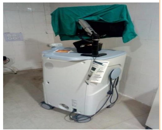
ଏମ୍‌ସିଏଚ୍, ବାରିପଦାରେ ଡିଜିଟାଲ୍ ଇମେଜିଙ୍ଗ୍ ସିଷ୍ଟମ (13 ଏପ୍ରିଲ 2022)

ଏହିପରି, ଏମ୍‌ସିଏଚ୍ କ୍ରୟ ସଂସ୍ଥା ଆବଶ୍ୟକତାର ମୂଲ୍ୟାଙ୍କନ ନକରି ଏବଂ ଅତିରିକ୍ତ ଭିଡିଭିଡି, ରିଏଜେକ୍ସ୍ ଇତ୍ୟାଦିର ବ୍ୟବସ୍ଥା ନକରି ଯନ୍ତ୍ରପାତି କ୍ରୟ କରିଥିଲେ । ଫଳସରୂପ, ବର୍ଷବର୍ଷ ଧରି ଏହିପରି ଯନ୍ତ୍ରପାତି ବ୍ୟବହାର କରାଯାଇ ନଥିଲା । ଏହା କେବଳ ଡାକ୍ତରୀ ଛାତ୍ରମାନଙ୍କର ଶିକ୍ଷଣ ଏବଂ ଅନୁସନ୍ଧାନକାର୍ଯ୍ୟକଳାପ ଉପରେ ପ୍ରଭାବ ପକାଇଲା ନାହିଁ, ବରଂ ଖର୍ଚ୍ଚ ମଧ୍ୟ ଅଫଳପ୍ରସ୍ତୁ ହେଲା ।