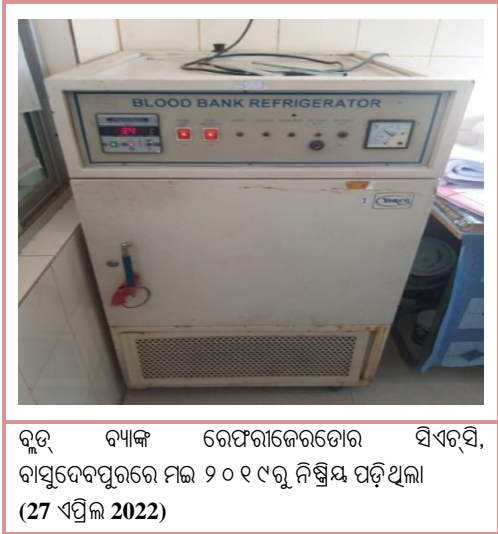
ବ୍ଲଡ୍ ବ୍ୟାଙ୍କ ରେଫରାଜେରଡୋର ସିଏଚ୍‌ସି, ବାସୁଦେବପୁରରେ ମଇ ୨୦୧୯ରୁ ନିଷ୍ପନ୍ନ ପଡ଼ିଥିଲା (27 ଏପ୍ରିଲ 2022)

ସିଏଚ୍‌ସି ଗୁଡ଼ିକରେ ରକ୍ତ ସଂରକ୍ଷଣ ସ୍ତୁନିଟ୍ ଗୁଡ଼ିକର ଉପଲବ୍ଧତା /ଅଣ-କାର୍ଯ୍ୟ ହେତୁ, ରକ୍ତ ଆବଶ୍ୟକ କରୁଥିବା ରୋଗୀଙ୍କୁ ଭଲ ସୁବିଧା ଥିବା (ଡିଏଚ୍‌ଏଚ୍/ ଏମ୍‌ସିଏଚ୍)କୁ ପଠାଯାଉଥିଲା କିମ୍ବା ନିଜେ ରକ୍ତ ସ୍ତୁନିଟ୍ ବ୍ୟବସ୍ଥା କରିବାକୁ କୁହାଯାଇଥିଲା ।