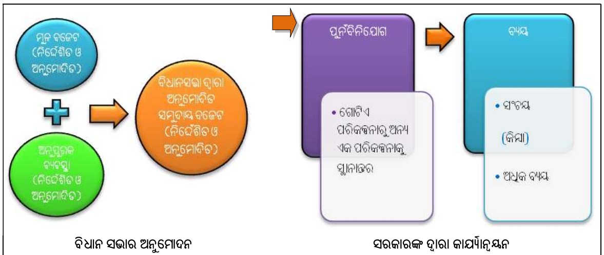
ରେଖାଚିତ୍ର 2.1: ବଜେଟ କାର୍ଯ୍ୟାନୁଷ୍ଠାନର ପ୍ଲେ ଚାର୍ଟ