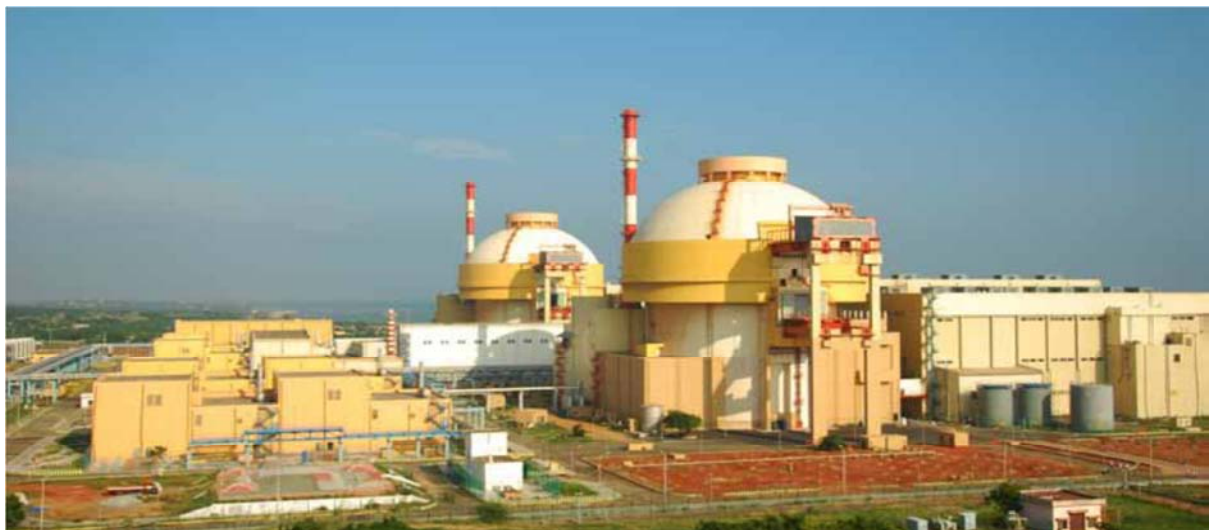
चित्र 1.1 कुडनकुलम नाभिकीय ऊर्जा संयंत्र - इकाई I और II

31 मार्च 2017 को इकाई-I एवं इकाई II की पूंजीगत परियोजना लागत 6 क्रमशः ₹ 11,523 करोड़ एवं ₹ 10,212 करोड़ थी।