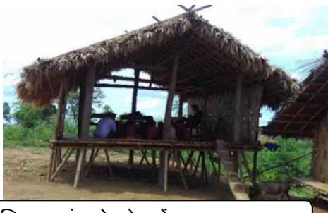
चित्र 2: बांस के शेड में चल रहा स्कूल

उत्तर त्रिपुरा जिले में धर्मनगर नगर पालिका परिषद के अंतर्गत