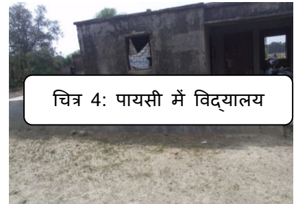
चित्र 4: पायसी में विद्यालय

➤ पीएस पायसी, गोरखपुर के प्रत्यक्ष सत्यापन से पता चला कि विद्यालय डेयरी/गोटेरी के रूप में उपयोग किया जा रहा था तथा पीएस पायसी भी यूपीएस पायसी के भवन में चल रहा था।