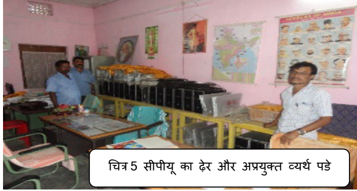
चित्र 5 सीपीयू का ढेर और अप्रयुक्त व्यर्थ पड़े

(ii) त्रिपुरा में एसएसए की अभिनव गतिविधियों के अंतर्गत सीएएल कार्यक्रम के लिए 2011-12 के दौरान पीएबी ने ₹1.85 करोड़ अनुमोदित किए थे। तदनुसार, एमएचआरडी ने मार्च 2012 में राज्य शिक्षा मिशन, त्रिपुरा को ₹1.85 करोड़ प्रदान किए थे। राज्य शिक्षा मिशन