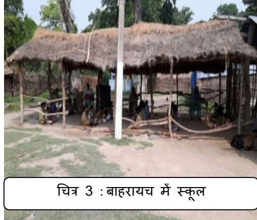
चित्र 3 : बाहरायच में स्कूल

➤ बाहरायच, गोरखपुर, सुलतानपुर और उन्नाव जिलों में 26 स्कूल भवनों में प्रत्येक में (कुल 58 स्कूल) 2 से 3 पीएस/यूपीएस थे। इस प्रकार, अधिनियम के कार्यान्वयन के छः वर्षों के पश्चात् भी स्कूलों को उचित स्कूल भवन प्रदान नहीं किए गए थे।