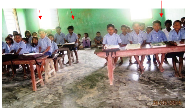
चित्र 1:दुबाचुरी के 656 सं. एलपीएस-बिलासीपाड़ा, धुबरी जिला (असम) के एक ही कमरे में तीन कक्षाएं (कक्षा I, II एवं क - श्रेणी) चल रही हैं।

एमएचआरडी ने बताया (दिसम्बर 2016) कि 2000-01 के बाद से 17.59 लाख अतिरिक्त कक्षाओं का निर्माण हुआ, परंतु हालांकि, मार्च 2016 तक, तथ्य रहे हैं कि 9.59 लाख विद्यालय प्रतिकूल शिक्षक कक्षा अनुपात वाले हैं।