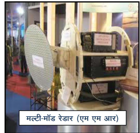
मल्टी-मॉड रेडार (एम एम आर)

एल सी ए में मल्टी-मॉड रेडार (एम एम आर) का प्रयोग समुद्र सहित हवा से हवा, हवा से जमीन के लक्ष्यों की खोज करने के लिए किया जाता है। यह सभी मौसमों में शस्त्रों की लांचिंग को सुसाध्य बनाता है। इसे विभिन्न मॉड पर कार्य करना चाहिए अर्थात् एकल लक्ष्य खोज (एस टी टी) 5 मॉड, निकट युद्ध मॉड और हवा से जमीन की ओर के मॉड।