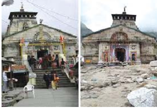
केदारनाथ आपदा से पूर्व एवं पश्चात

सरकार के पास चार-धाम 1 यात्रियों के कोई आँकड़े नहीं थे जिसका उपयोग कर चार-धाम जाने वाले यात्रियों की सही-सही संख्या सुनिश्चित की जा सके। अतएव, उपरोक्त के अभाव में सरकार उन तीर्थयात्रियों की निश्चित संख्या नहीं बता सकी जो कि आपदा के दौरान केदारनाथ में थे या 15 और 17 जून, 2013 के मध्य चार-धाम के यात्रा मार्ग में फंसे हुए थे।