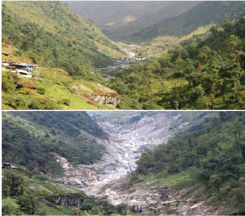
रामबाड़ा आपदा से पूर्व एवं पश्चात

त्रासदी की व्यापकता एवं तीव्रता का गुणात्मक प्रभाव था। उत्तराखण्ड राज्य के सभी विख्यात तीर्थस्थल जैसे बद्रीनाथ, केदारनाथ, गंगोत्री, यमुनोत्री एवं हेमकुण्ड साहिब, जो कि उत्तरी उच्च पर्वतों, हिमाच्छादित क्षेत्रों में स्थित हैं, बुरी तरह से प्रभावित हुए। सूचना के अनुसार जनपद रुद्रप्रयाग में ऊपरी मन्दाकिनी नदी-घाटी में स्थित पवित्र तीर्थस्थल, प्राचीन श्री केदारनाथ धाम अधिकतम क्षति तथा जनहानि के साथ राज्य के सर्वाधिक बुरे प्रभावित क्षेत्रों में से एक था। कुछ ही क्षणों में समग्र श्री केदारनाथ