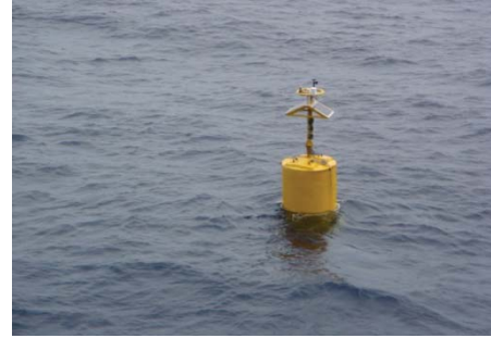
स्पर प्रकार का निम्न लागत प्लव

एन.आई.ओ.टी. ने प्लवों की डिजाइन तथा विरचना के लिए दिसम्बर 2007 तक दो प्रयास किए परन्तु विफल रहे क्योंकि एक प्लव परिनियोजन के दौरान क्षतिग्रस्त हो गया था और दूसरे प्लव ने केवल एक सप्ताह कार्य किया था। एन.आई.ओ.टी. ने नई डिजाइन के साथ एक और प्रयास करने और जून 2008 तक 25 ऐसे प्लव परिनियोजित करने का निर्णय लिया (जनवरी 2008)। तथापि एन.आई.ओ.टी. ने नई डिजाइन से केवल दो प्लव विकसित किए और परिनियोजन पर (मार्च 2008) इन प्लवों ने केवल एक माह के लिए डाटा संचरित किया।