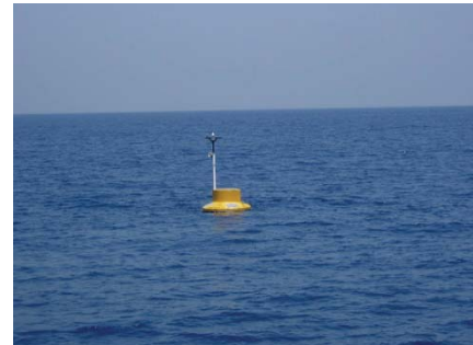
समुद्र में डाटा प्लव

परियोजना में भारत के ई.ई.जैड. 34 महासागरों में विभिन्न मौसम संबंधी तथा समुद्र विज्ञान पर समय श्रेणी डाटा के संग्रहण हेतु तीन वर्षों