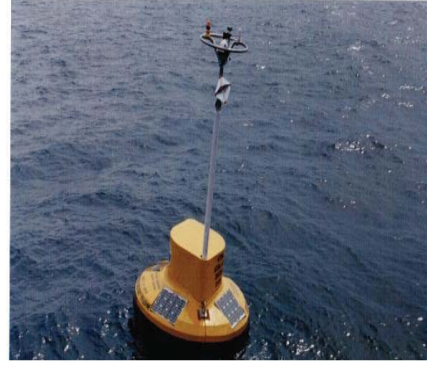
पहला देशीकृत प्लव

बाद में एन.आई.ओ.टी. ने सहयोगी परियोजना के कार्यान्वयन के दौरान प्राप्त किए गए अनुभव के आधार पर अलग परियोजना के रूप में देशज प्लव प्रौद्योगिकी के विकास की प्रक्रिया आरम्भ की। एन.आई.ओ.टी. ने संवेदको, जिनकी आयात किए जाने की योजना थी, को छोड़कर भारतीय सैटेलाइट (इनसैट) का उपयोग कर सैटेलाइट संचार सहित प्लव की सभी यांत्रिक, विद्युतीय तथा बंधन प्रणाली को देशीकृत करने