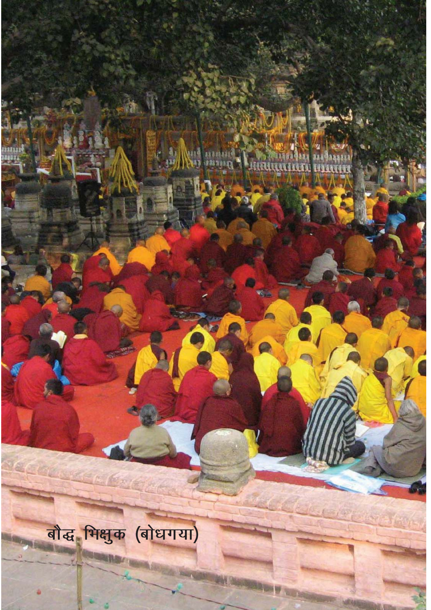
बौद्ध भिक्षुक (बोधगया)