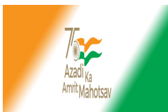
Azadi.jpg 60 KB