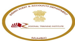
logo.jpg 24 KB

CAG-ALL-OFFICES mailing list -- cag-all-offices@lsmgr.nic.in To unsubscribe send an email to cag-all-offices-leave@lsmgr.nic.in