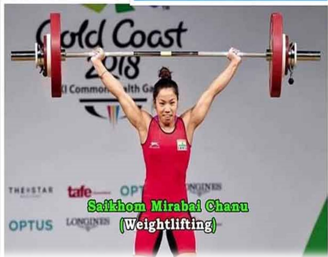
Saikhom Mirabai Chanu (Weightlifting)

मणिपुर के लिए भारत में सिर्फ खेलों का पावरहाउस होना ही काफी नहीं है। हमें बहुत मेहनत करनी है, अंतर्राष्ट्रीय स्तर पर बेहतर प्रदर्शन करना है ताकि हम भारत का प्रतिनिधित्व कर सकें और हर विषय में चीन, संयुक्तराज्य अमेरिका, जापान, ऑस्ट्रेलिया, कोरिया आदि देशों के साथ प्रतिस्पर्धा कर सकें। हमें जमीनी स्तर से काम करना होगा। हाल ही में संपन्न टोक्यो ओलंपिक में भव्य स्वागत, नकद पुरस्कार, मीडिया कवरेज, उपहार, उच्च सरकारी पदों पर नियुक्ति आदि जैसे ओलंपियनों को दिया गया प्रोत्साहन निश्चित रूप से अगली पीढ़ियों को खेलों और खेलों में अपने कैरियर का चयन करने के लिए प्रोत्साहित करेगा। एक बार, मणिपुर में राष्ट्रीय खेल विश्वविद्यालय का निर्माण पूरा हो जाता है और यह पूरे जोरों पर काम करना शुरू कर देता है, मुझे लगता है कि मणिपुर से और खिलाड़ी सामने आएंगे। हम निकट और दूर के भविष्य में और अधिक पदक और ट्रॉफियां की उम्मीद कर सकते हैं। खेलों और खेलों में मणिपुर का भविष्य उज्ज्वल दिख रहा है।