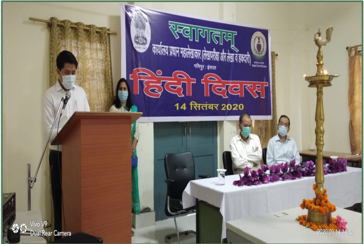
पिछले वर्ष हिंदी दिवस पर माननीय गृह मंत्री का संदेश पढ़ते हुए वरिष्ठ उप महालेखाकार