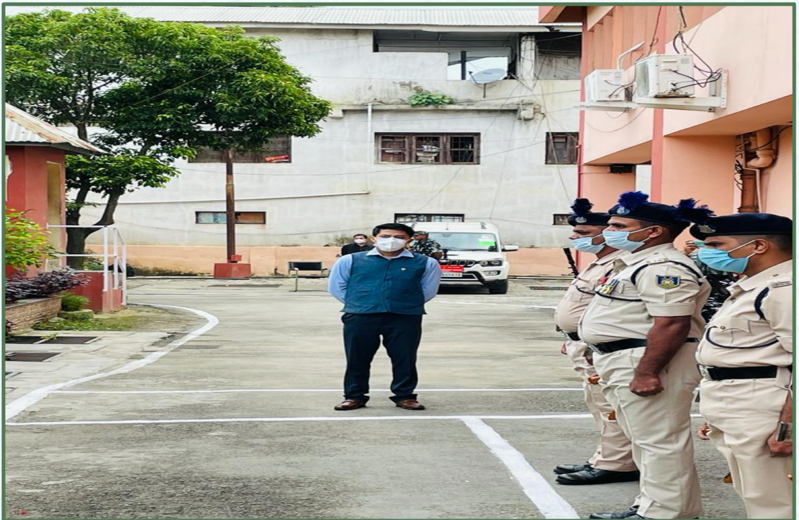
स्वतंत्रता दिवस के अवसर पर वरिष्ठ उप महालेखाकार संबोधित करते हुए सी.आर.पी.एफ के जवानों को