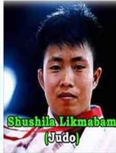
Shushila Likmabam (Judo)