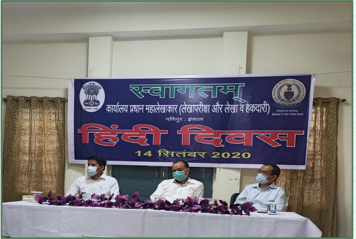
पिछले वर्ष हिंदी दिवस की झलकियां