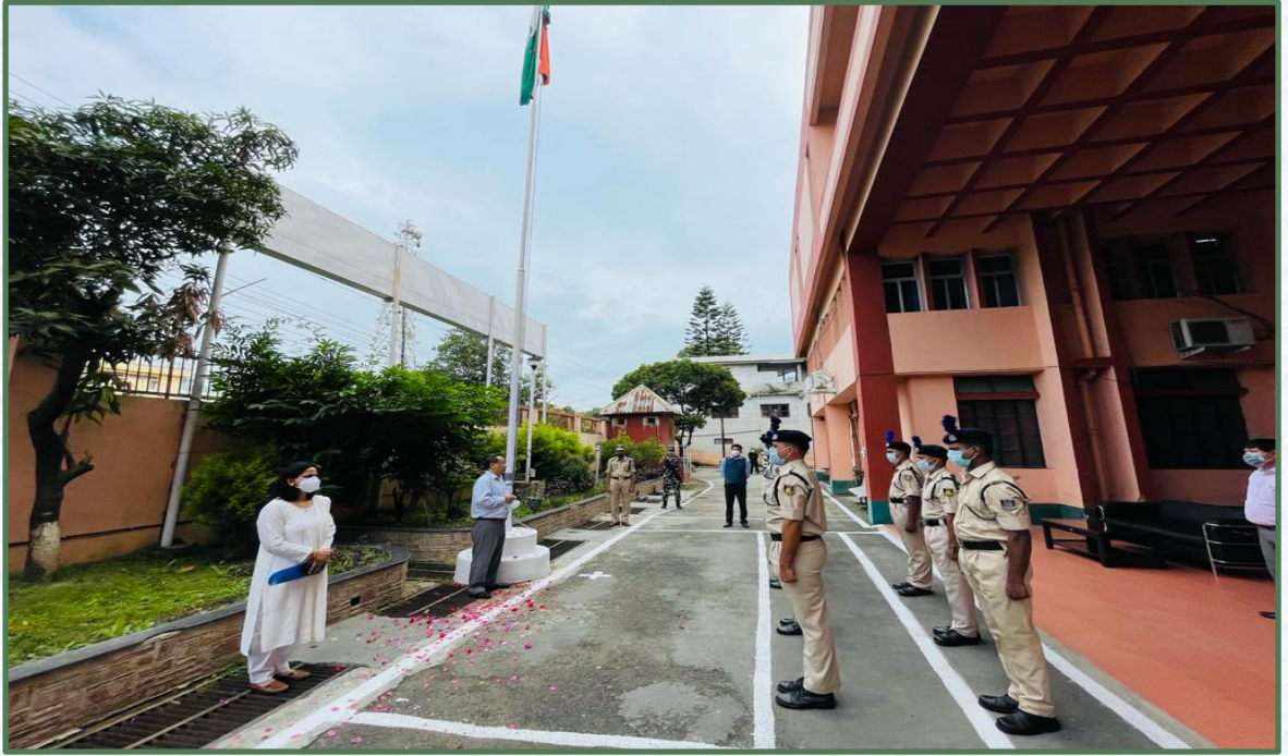
स्वतंत्रता दिवस के अवसर पर प्रधान महालेखाकार का वक्तव्य