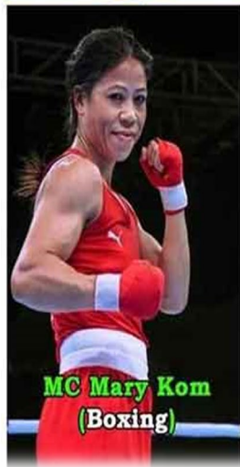
MC Mary Kom (Boxing)